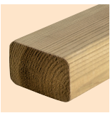
Lambourde Pin Rouge du Nord 45 x 70 mm Préservation Classe 4 en autoclave vert ou marron Marquage CE selon NF EN 14081-1 Classe mécanique C24