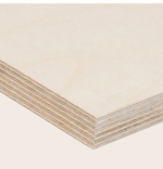
Peuplier Ingénierie blanchi